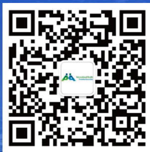
微信公众号二维码